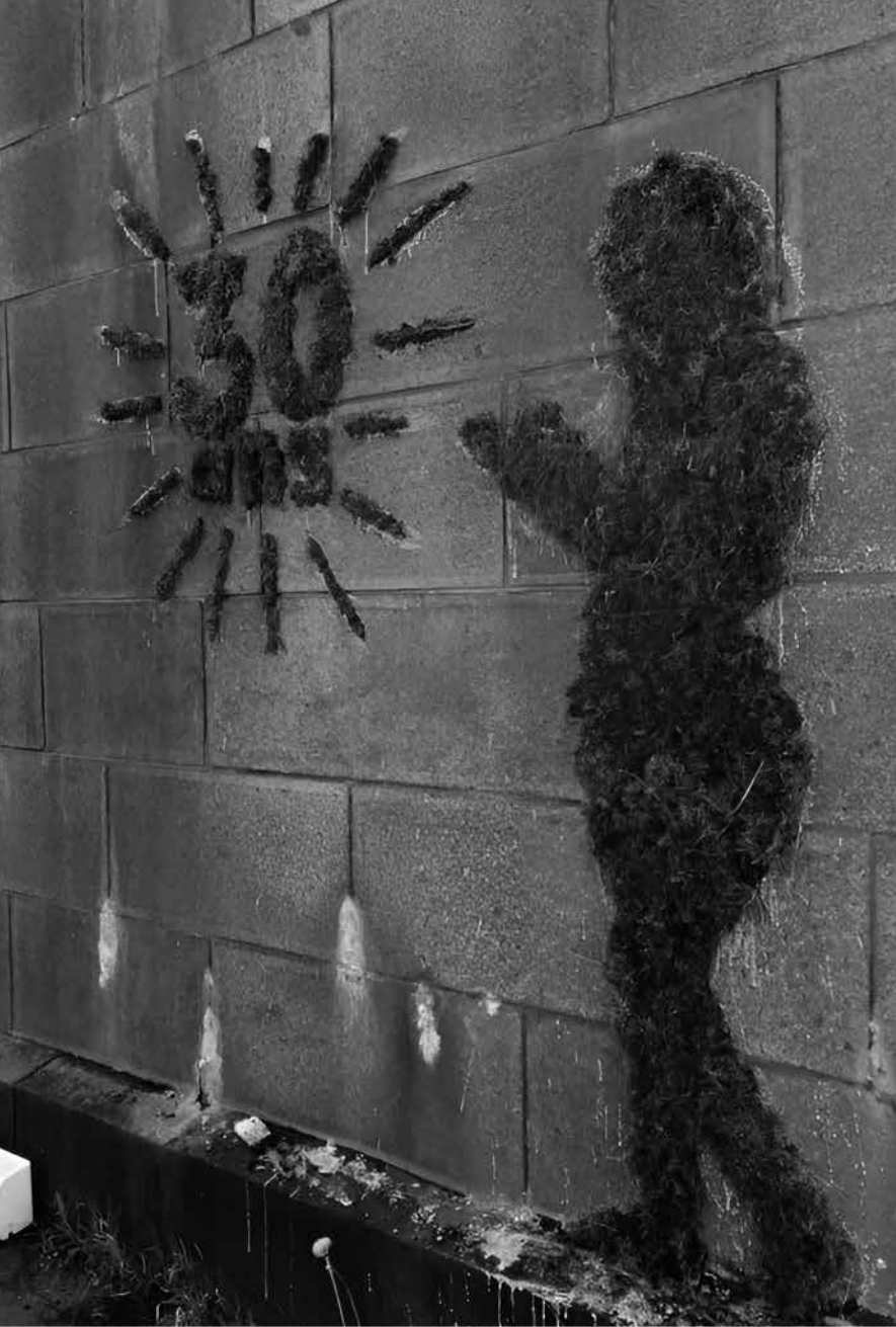
Green tag réalisé dans le cadre des 30 ans de Lecture en Tête par Charles Rihart, membre du collectif Good Good Mood (mur du Viaduc de Laval)